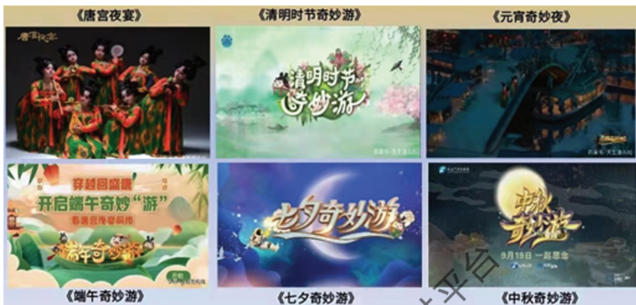
河南电视台奇妙游系列节目

捧明珠，愿天下太平；火龙腾空，现耀目铁花；非遗传承，庆中秋佳节”，一镜到底感受中原文化的瑰丽精彩，尝试提出中原文化品牌塑造的建议。