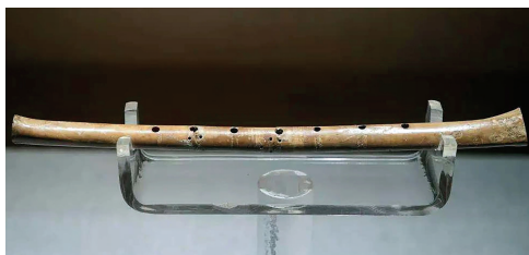
贾湖骨笛——9000 年的绝响