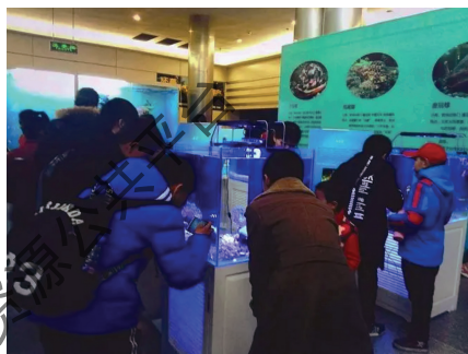
参观河南自然博物馆

实地参观河南自然博物馆，了解地球的地质演化过程，认识自然环境各要素之间的相互作用关系，认识自然环境为文明发展提供的必要物质基础，针对性收集馆内有关河南的自然要素资料（地形、气候、水文、土壤、地质演化、物种变迁）