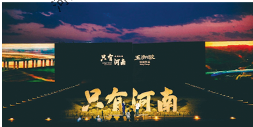
只有河南·戏剧幻城

了解河南文化旅游产业的发展硕果，通过戏剧场景微缩景观近距离触摸5000年中原文化的厚重根基，在沉浸式参与中认识中原文化的宝贵遗产，培养学生“老家河南”的自豪感和胸怀天下的胸襟，激发学生热爱土地、眷恋故乡的情怀。