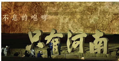
只有河南·戏剧幻城

河南博物院、河南自然博物馆、平顶山叶县标准化农田基地、“只有河南·戏剧幻城”文化旅游项目、河南电视台奇妙游系列节目，是河南近年来“出圈”的各行业代表性名片，在疫情紧张时期，不便于长途旅行，这几处研学地距离较近，便于集体出行，且组合新颖，内容丰富，符合黄河流域生态保护和高质量发展的研学主题。