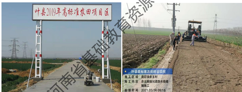
平顶山叶县标准化农田基地

参观平顶山叶县标准化农田基地，认识标准化农田和现代农业发展，了解河南作为中国粮仓的重要地位；认识中原农业发展的优势和短板；思考农耕文明对中原文化的深远影响；“留住乡愁，做美田头”，让村民吃上“旅游饭”，结合叶县农业生态公园实例，说明农文结合的新方式。